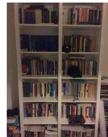
De tweedeling in de boekkast. De linker kant om 'in de schoenen' te komen, de rechter kant 'de zoektocht naar vernieuwing'.

Door jezelf de vraag te stellen waardoor of waarom je in hun schoenen precies hetzelfde zou doen, stimuleer je jezelf om met compassie te begrijpen. Daarbij wordt 'begrip' weleens opgevat als goedpraten, merkte Landman. "Dat is een misvatting. Je kunt iets begrijpen en tegelijkertijd wijzen op de onwenselijke effecten ervan. Noem het 'kritische empathie'."